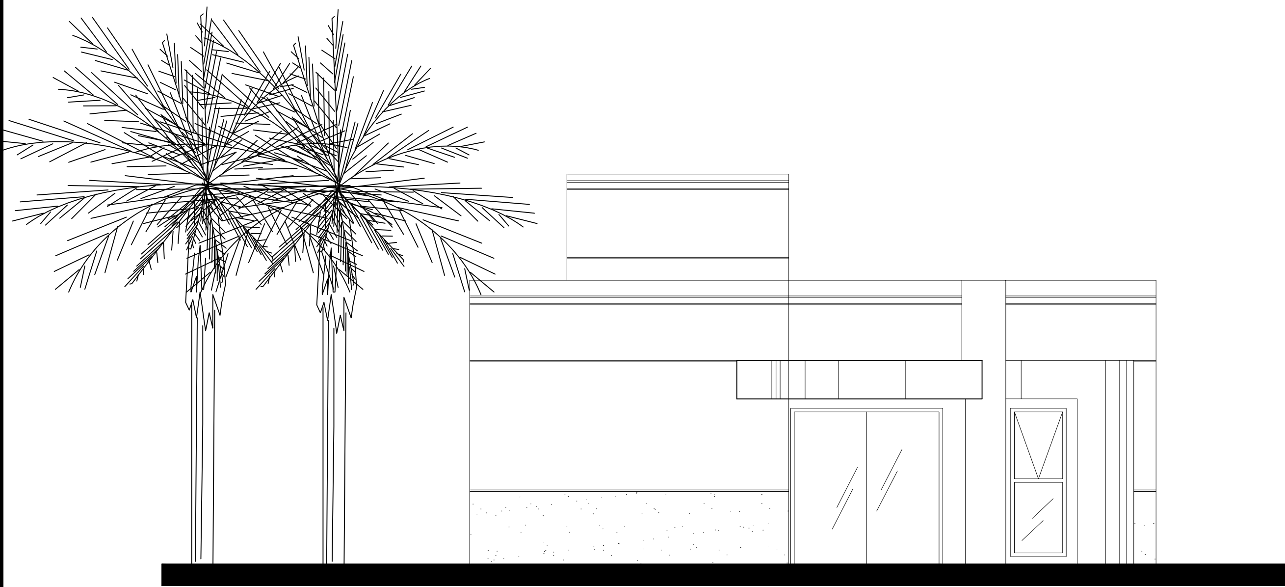
FACHADA ÁREA: 213,78 m²